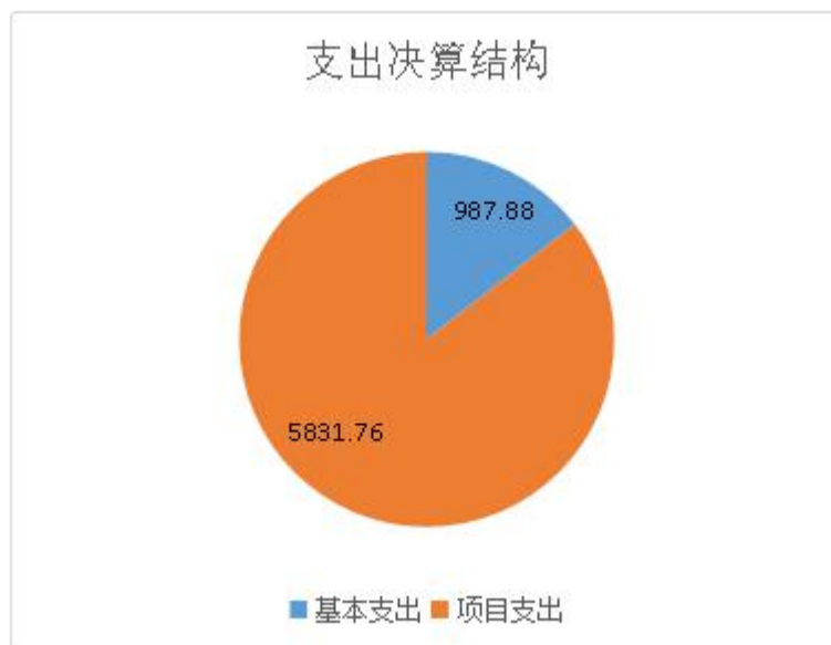
图 3: 支出决算结构单位: 万元

支出 0.00%; 经营支出 0.00 万元, 占本年支出 0.00%; 对附属单位补助支出 0.00 万元, 占本年支出 0.00%。