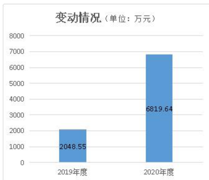
图 1: 收、支决算总计变动情况单位: 万元

2020 年度收、支总计 6,819.64 万元。与 2019 年度相比,收、支总计各增加 4,771.09 万元,增长 232.90%,主要原因是人员增加及部分项目开支增加。