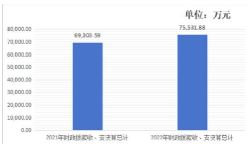
图4：财政拨款收、支决算总计变动情况

2022年度财政拨款收入中，一般公共预算财政拨款收入49,708.93万元，比2021年度决算数增加33337.93万元。增加主要原因是：2022年，企业扶持发展金比2021年增加28486.68万元，城乡社区公共设施建设比2021年增加2052.51万元，新增项目运维费869.06万元。政府性基金预算财政拨款收入25,822.95万元，比2021年度决算数减少27109.64万元。减少主要原因是：2022年，园区办减少了专项债券收支30000万元。