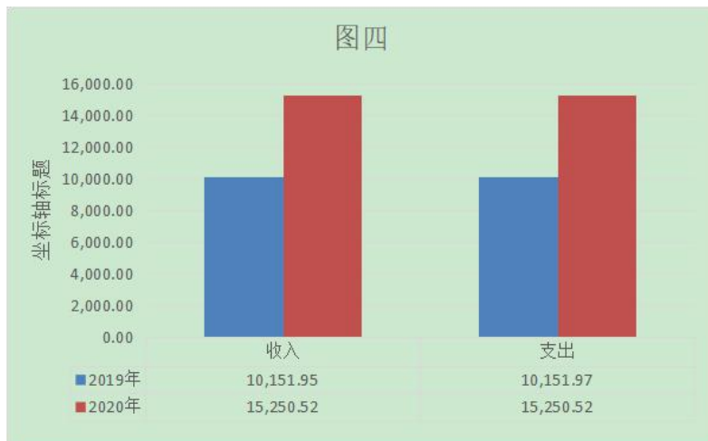
图 4: 财政拨款收、支决算总计变动情况

2020 年度财政拨款收、支总计 15,250.52 万元。与 2019 年度相比,财政拨款收、支总计各增加 5,098.57 万元,增长 50.22%。主要原因是防疫支出。