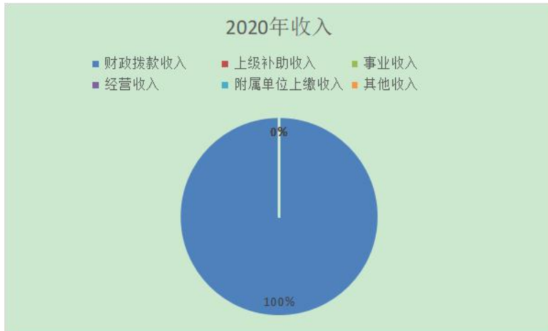
图 2: 收入决算结构