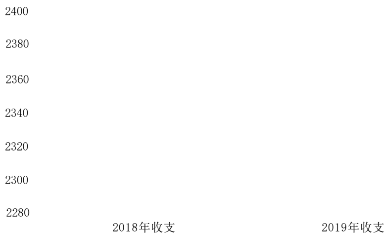
图1:收、支决算总计变动情况 金额

2019年度收、支总计2,383.39万元。与2018年相比,收、支总计增加68.77万元,上升了2.97%,主要原因是人员工资及社会保障费用增加所致。