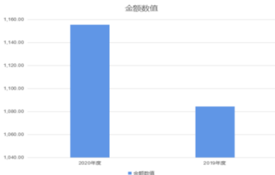
财政拨款收、支决算总计变动情况