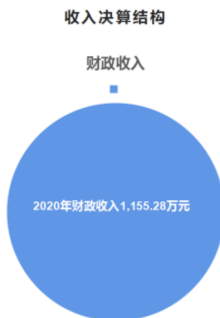
图 2：收入决算结构(略)

2020 年度收入合计 1,155.28 万元。其中：财政拨款收入 1,155.28 万元，占本年收入 100.00%；上级补助收入 0.00 万元，占本年收入 0.00%；事业收入 0.00 万元，占本年收入 0.00%；经营收入 0.00 万元，占本年收入 0.00%；附属单位上缴收入 0.00 万元，占本年收入 0.00%；其他收入 0.00 万元，占本年收入 0.00%。