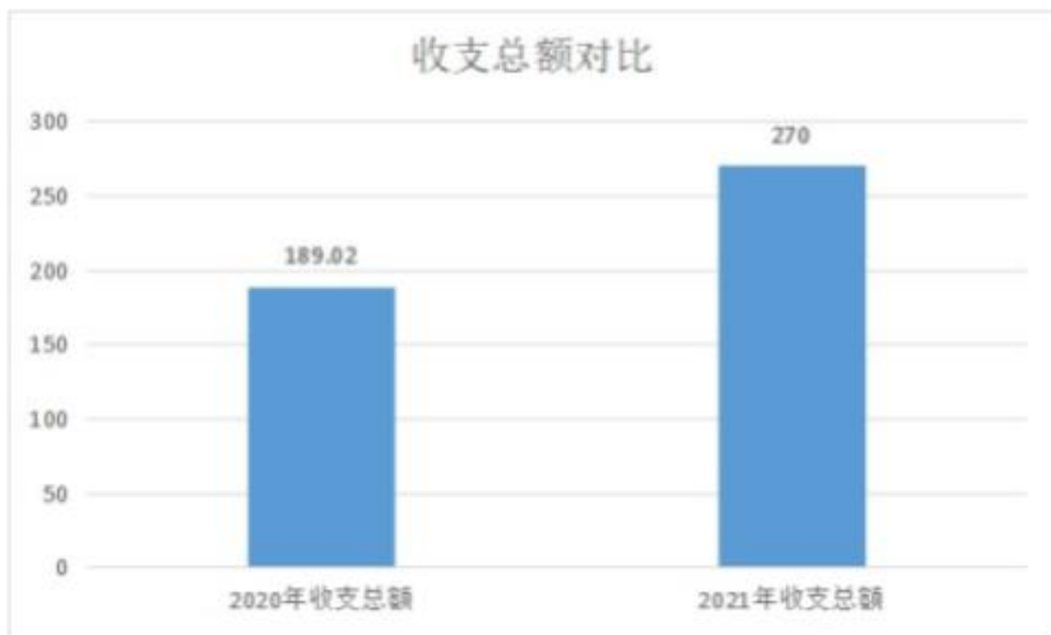
图 1：收、支决算总计变动情况（略）

2021 年度收、支总计 270.00 万元。与 2020 年度相比，收、支总计各增加 80.98 万元，增长 42.84%，主要原因是 2021 年因工作需要，新招工录工作人员，人员增加形成支出增加。