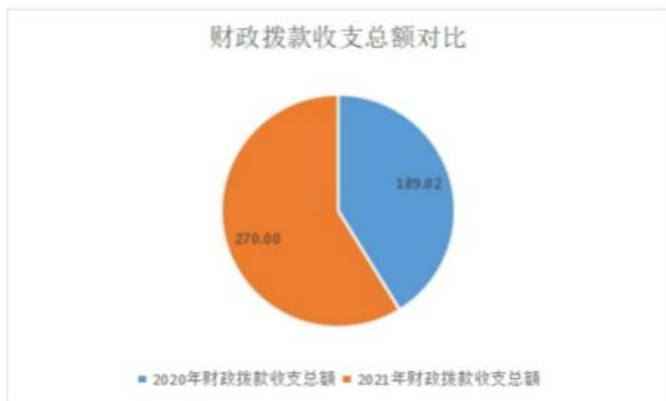
图 4：财政拨款收、支决算总计变动情况（略）

2021 年度财政拨款收、支总计 270.00 万元。与 2020 年度相比，财政拨款收、支总计各增加(减少)80.98 万元，增长(下降)42.84%。主要原因是人员增加形成支出增加。