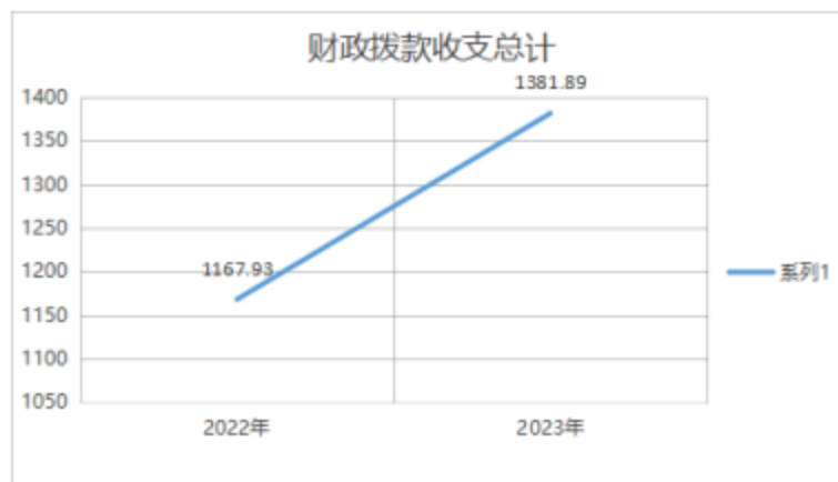
图4：财政拨款收、支决算总计变动情况

2023 年度财政拨款收入中，一般公共预算财政拨款收入 1,381.89 万元，比 2022 年度决算数增加 213.96 万元。增加主要原因是在编人员 2022 年第四季度绩效在 2023 年发放，在编人员机保调整。