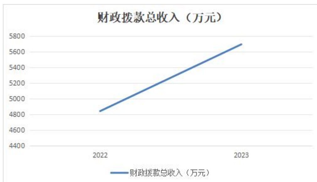
图4：财政拨款收、支决算总计变动情况

2023 年度财政拨款收、支总计 5,695.59 万元。与2022 年度相比，财政拨款收、支总计各增加853.83 万元，增长17.63 %。主要原因是1. 2022年第四季度绩效工资在2023年1月发放，2023年又完整的发放了本年度的四个绩效工资。增加了绩效工资支出。2. 2023年补缴了2022年工资调标导致的教师机关养老保险标准提高的部分。