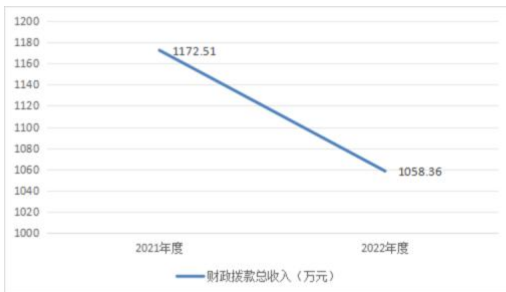
图4：财政拨款收、支决算总计变动情况

2022年度财政拨款收入中，一般公共预算财政拨款收入1,058.36万元，比2021年度决算数减少114.45万元。减少主要原因是学生人数减少；2022年疫情期间上网课时间较多；工资改革前，绩效奖金为预发数，且第四季度考核未完成，第四季度绩效工资在2023年元月份发放。