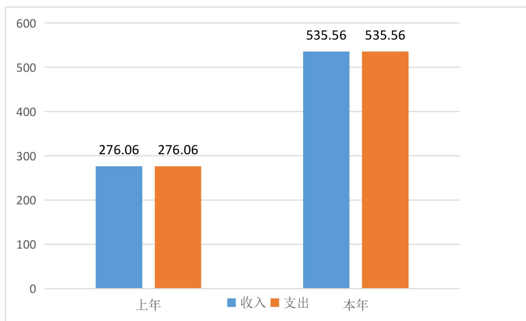
图 1：收、支决算总计变动情况（略）

2021 年度收、支总计 535.56 万元。与 2020 年度相比，收、支总计各增加 259.5 万元，增长 94.0 %，主要原因是本单位为 2020 年新成立单位，2020 年只有半年经费支出。