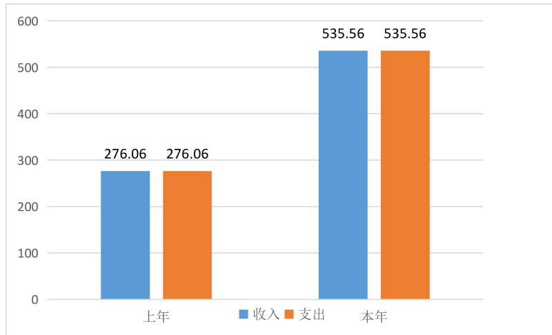
图4：财政拨款收、支决算总计变动情况（略）

年度相比，财政拨款收、支总计各增加 259.5 万元，增长(下降) 94.0 %。主要原因是本单位为2020年新成立单位，2020年只有半年经费支出。