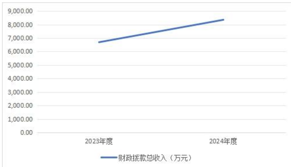
图4：财政拨款收、支决算总计变动情况

2024年度财政拨款收入中，一般公共预算财政拨款收入8,351.5万元，比2023年度决算数增加1,802.56万元。增加主要原因是本年度安排了上级转移支付2023年补充耕地指标省级补偿资金。政府性基金预算财政拨款收入0万元，比2023年度决算数减少140.59万元。减少主要原因是本年度未安排政府性基金预算收入支出。国有资本经营预算财政拨款收入0万元，比2023年度决算数增加（减少）0万元。