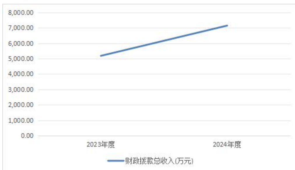
图4：财政拨款收、支决算总计变动情况

2024年度财政拨款收入中，一般公共预算财政拨款收入7,155.32万元，比2023年度决算数增加2,108.75万元，增长41.8%，主要原因是本年度安排了上级转移支付2023年补充耕地指标省级补偿资金。政府性基金预算财政拨款收入0万元，比2023年度决算数减少100%，主要原因是本年度未安排政府性基金预算收入支出。国有资本经营预算财政拨款收入0万元，比2023年度决算数增加(减少)0万元。