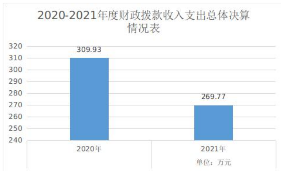
图4：财政拨款收、支决算总计变动情况

2021年度财政拨款收、支总计269.77万元。与2020年度相比，财政拨款收、支总计各减少40.16万元，下降13.0%。主要原因是：一、受疫情影响，课题研究进度迟缓，未结项支付尾款；二、坚持厉行节约原则，从严从紧控制支出。