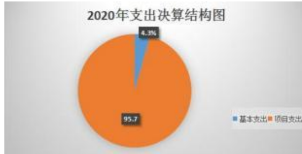
图 3：支出决算结构图

本部门使用 2010350 事业运行、2010399 其他政府办公厅（室）及相关机构事务支出、2070604 新闻通讯、2120803 城市建设支出等科目。