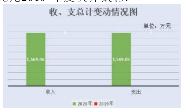
图 1：收支决算总计变动情况图

2020 年度收、支总计 1,569.06 万元。与 2019 年度相比，收、支总计各增加 1,569.06 万元，增长 100%，主要原因是大数据中心 2020 年 6 月才筹建成立，因此无 2019 年度决算数据。